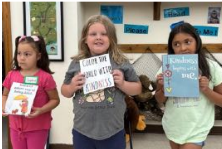
An emphasis was placed on peace and kindness!