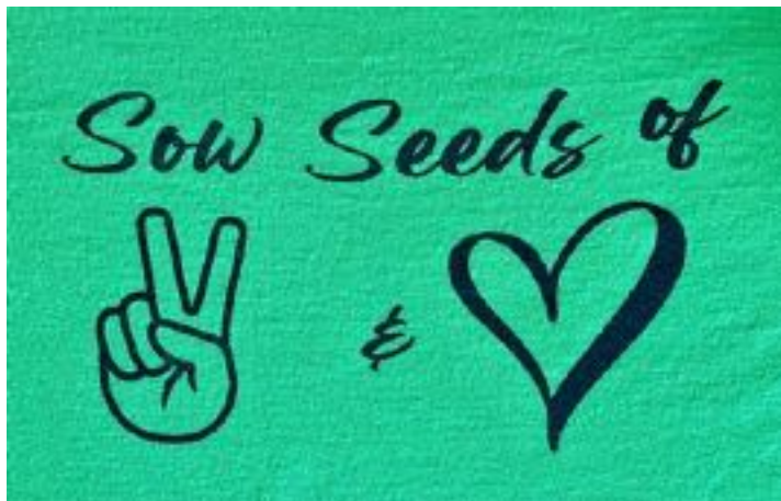
Each camper received a shirt that was emblazoned with Sow Seeds of Peace and Love.